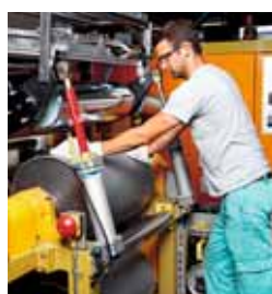
2 Rullo con supporto