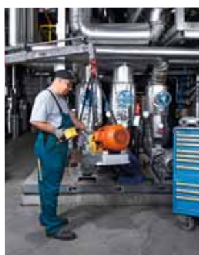
Regola 2 No alle improvvisazioni.