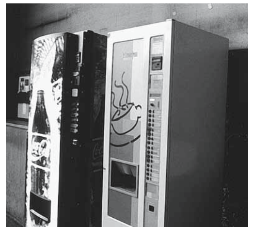
Distributori in prossimità dei posti di lavoro.

Per ulteriori consigli e informazioni rivolgersi a: Radix, Via Trevano 6, 6900 Lugano, tel. 091 922 66 13, www.radixsvizzeraitaliana.ch