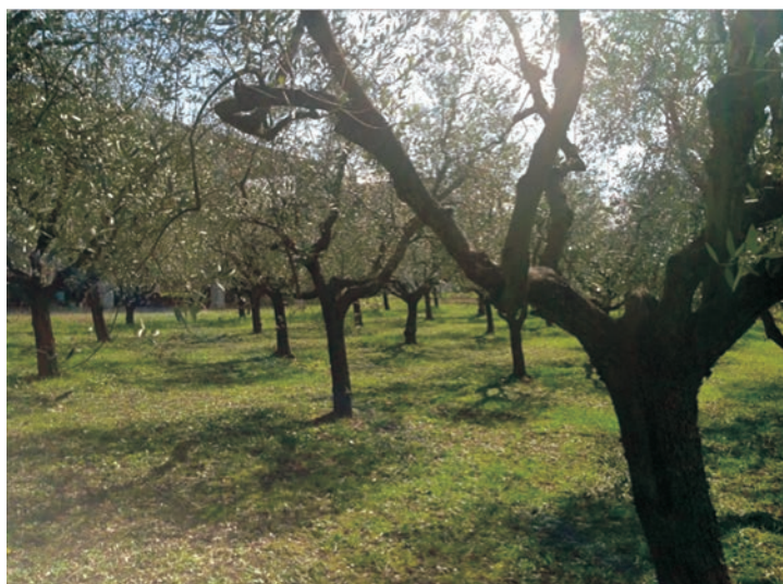
Figura 2: Oliveto in coltivazione - az agr. Minichiello - Grottaminarda (AV)

La gran parte degli oliveti, soprattutto in Campania, sono ubicati in zone collinari e aride, comunque senza impianti irrigui. Pertanto, la conservazione della fertilità del terreno richiede l'adozione di sistemi di gestione sostenibili, che non prevede l'utilizzo di frequenti e profonde lavorazioni meccaniche.