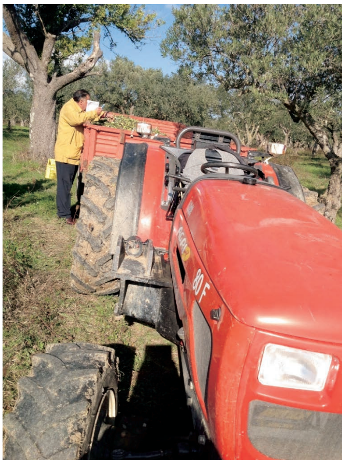
Figura 15: Trasporto olive al frantoio - Azienda Agricola Guerrea - S. Lupo (BN)

Il settore olivicolo rappresenta un importante comparto produttivo, con una produzione di circa 484.000 tonnellate di olive che vengono raccolte principalmente nel periodo che va da novembre a dicembre.