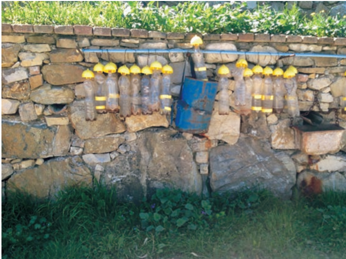
Figura 8: Metodo di difesa biologico dai fitofagi - Az Agr. Grasso Pasquale - Caposele (AV)

Tuttavia, gli agricoltori riferiscono, che in presenza di forti attacchi, come negli ultimi anni, l'utilizzo della trappola al feromone sessuale da sola non sia molto efficace. Pertanto, in presenza di fenomeni sempre più frequenti per i mutamenti climatici in atto, si può prevedere l'uso di insetticidi irrorati su tutta la pianta in funzione larvicida. Il numero di trattamenti necessari con il metodo curativo può variare, in dipendenza dell'andamento climatico e della varietà, da 1 a 3; nelle zone più esposte agli attacchi della mosca essi vengono eseguiti normalmente in agosto, settembre e ottobre-novembre.