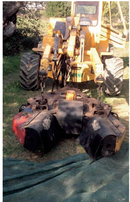
Figura 12: Aggancio dello scuotitore - Azienda Agricola Palma Pasquale - S. Lupo (BN)

Il sistema di intercettazione più diffuso, per entrambi i metodi di raccolta, consiste nella stesura, direttamente sul terreno e sotto la chioma della pianta, di reti in plastica di dimensioni superiori alla proiezione della stessa chioma.