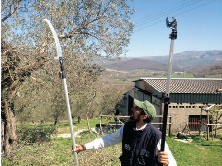
Figura 5: Attrezzi per la potatura - Azienda Agricola Grasso Gelsonimo - Caposele (AV)