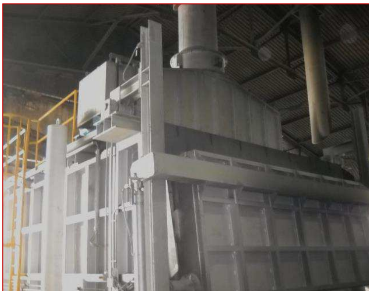
Figura 2. Vista del forno fusorio al termine dei lavori di costruzione.

"Sul tetto del forno correvano, perpendicolarmente alla bocca di carico, delle travi in acciaio poste a circa 70 cm dalla volta in precedenza realizzata. Sopra la volta doveva essere sistemato l'isolamento e poi, a completamento, la gettata con cemento C50. Durante la gettata io stavo in equilibrio con i piedi su due travi che distavano tra loro circa 50 cm."