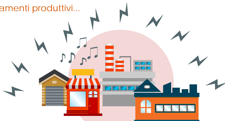
Fabbriche, laboratori artigianali, bar, ristoranti, impianti sportivi

...va segnalato il problema al proprio Comune .