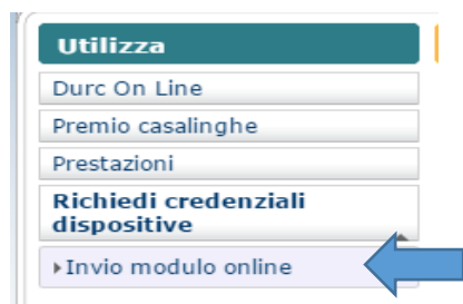
FIG. 4 – servizio on line Richiedi Credenziali dispositive – invia modulo