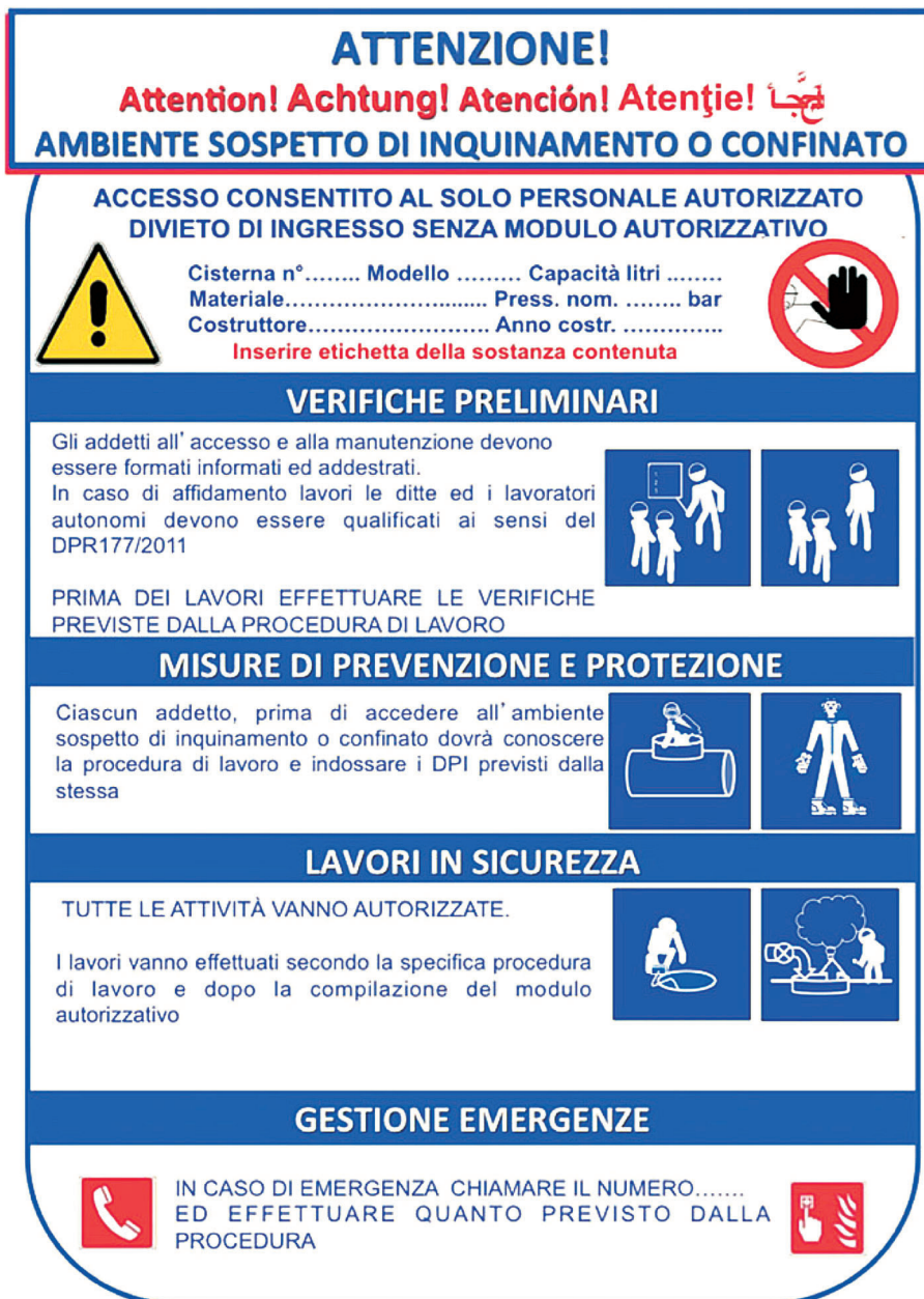
Figura 3: cartellonistica da apporre in ambienti confinati o sospetti di inquinamento : "Manuale illustrato Inail per lavori in ambienti sospetti di inquinamento o confinati ai sensi dell'art. 3, comma 3, del DPR 177/2011")