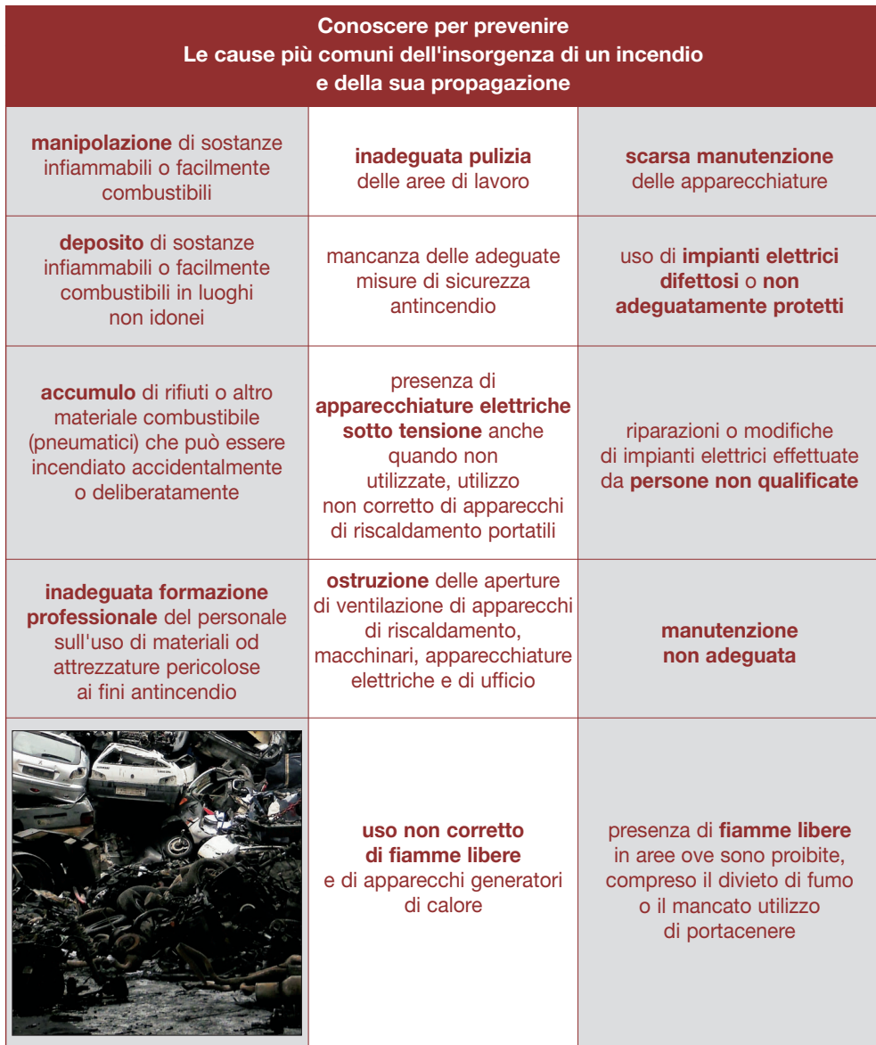
Tabella 3 - Le cause più comuni di un incendio