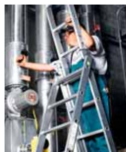
4 Scala portatile