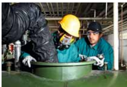
1 Lavori di molatura in una cisterna pulita: ventilazione e protezione delle vie respiratorie sono necessarie