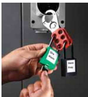
1 Dispositivo di chiusura multipla