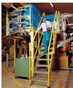
1 Piattaforma di lavoro fissa con parapetto