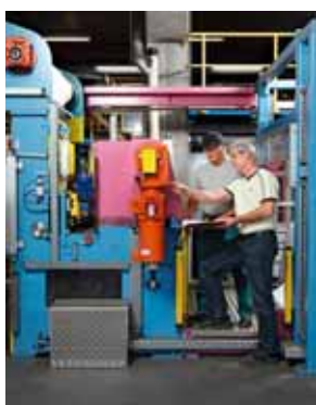
Regola 1 Pianificazione accurata dei lavori.