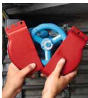
3 Blocco per valvola