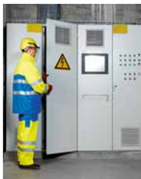
Regola 6 Solo professionisti per i lavori elettrici.