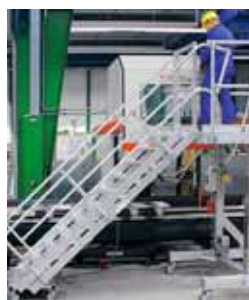
2 Piattaforma di lavoro mobile