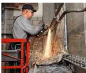
1 Protezione dei cavi elettrici