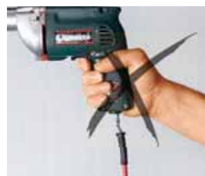
4 Apparecchio difettoso