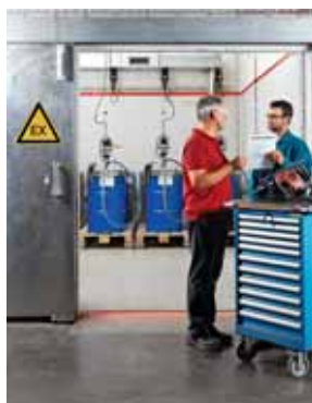
Regola 7 Evitare incendi ed esplosioni.