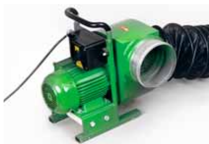
2 Ventilatore con tubo flessibile