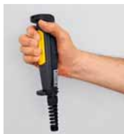
4 Tasto di consenso a tre stadi