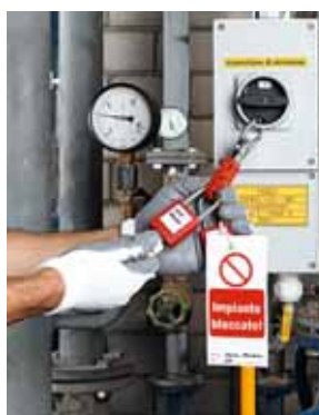
Regola 3 Disinserire e mettere in sicurezza l'impianto.