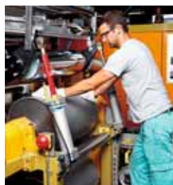
2 Rullo con supporto