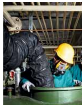
Regola 8 Aria pulita negli spazi ristretti.