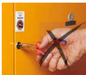
3 Non aprire!