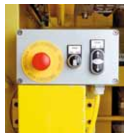
5 Comando a impulsi con arresto d'emergenza