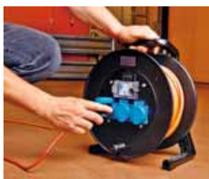
2 Interruttore salvavita mobile (RCD)