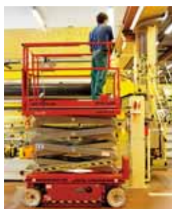
3 Ponte sollevatore a forbice