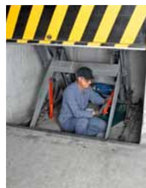
Regola 4 Rendere innocue le energie residue.