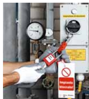
4 Blocco segnalato