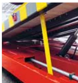
1 Piattaforma elevabile messa in sicurezza