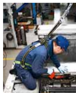
5 Dispositivo di protezione individuale anticaduta