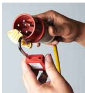
2 Chiusura per spine industriali