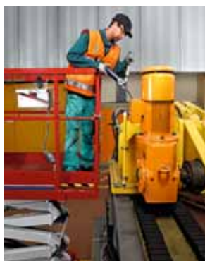
Regola 5 Evitare i rischi di caduta dall'alto.