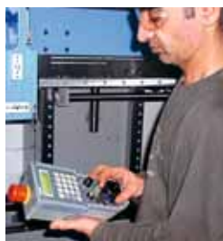
3 Volantino elettronico