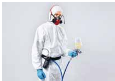
3 Respiratore ad adduzione di aria compressa con semifacciale, tuta chimica e guanti