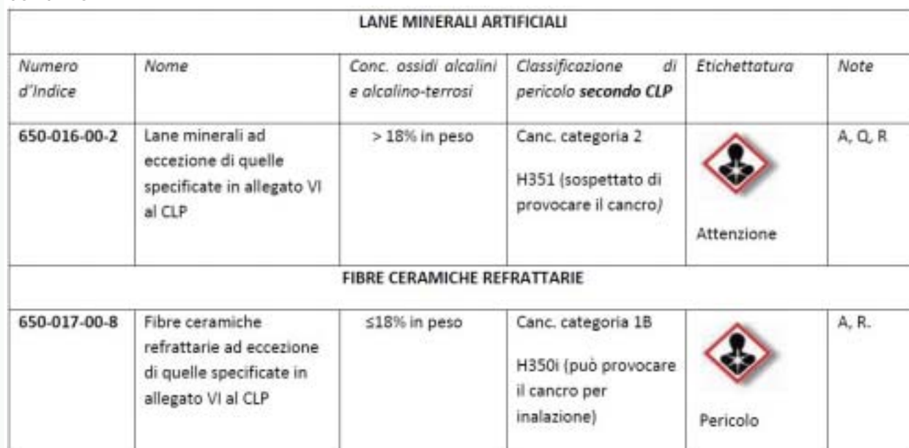
Tab. 3 – Classificazione delle FAV tratta dall'Allegato VI del CLP