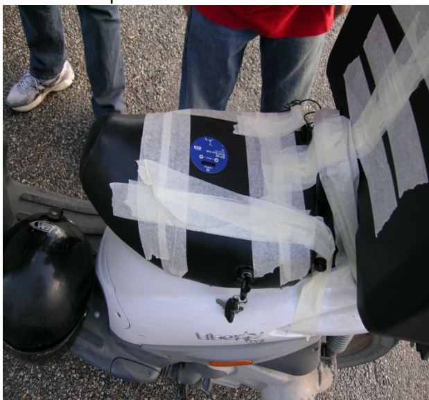
Tab. 3a -Livorno Mezzo valutato: Motociclo Piaggio Liberty 125 km percorsi alla data delle misure: 22.500 km