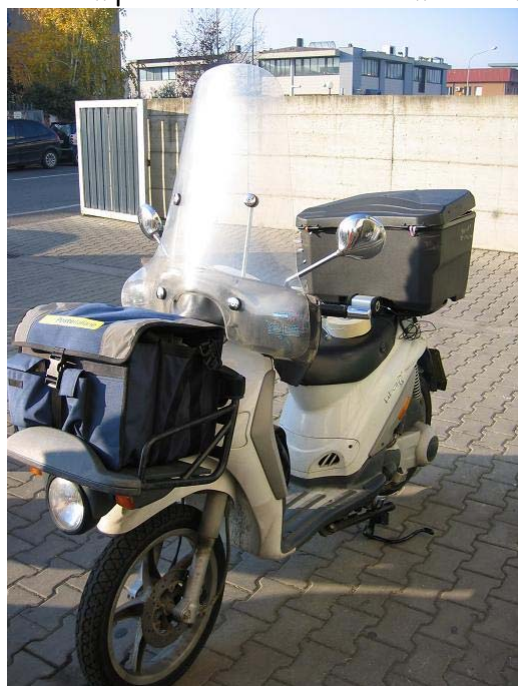
Tab. 3b -Arezzo Mezzo valutato: Motociclo Piaggio Liberty 125 km percorsi alla data delle misure 29.083