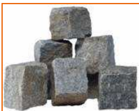
Cubetti al termine della lavorazione

Conosce pochissime parole di Italiano, ma il lavoro che svolge, di tipo manuale e perlopiù individuale, non prevede grossi scambi con colleghi e superiori e non necessita quindi di un vocabolario molto articolato. Inoltre, il rumore assordante e la diversa provenienza dei lavoratori (Marocco e Cina) complicano ulteriormente la comunicazione durante le ore di lavoro.