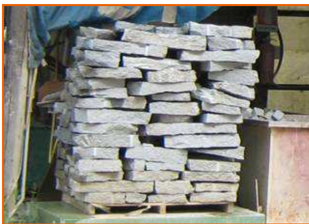
Bancale di pietre ancora da spaccare per la realizzazione di cubetti

Durante i lavori per la realizzazione di cubetti in pietra, un operaio ha subito una ferita da schiacciamento alla mano destra riportando un'invalidità permanente del 46%.