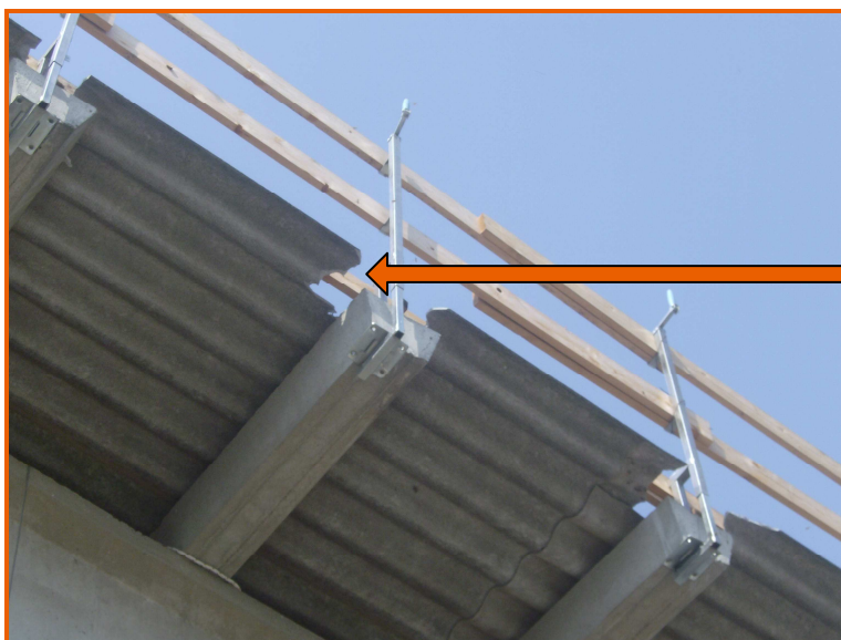
Particolare delle demolizioni delle parti esterne delle lastre di copertura in cemento amianto