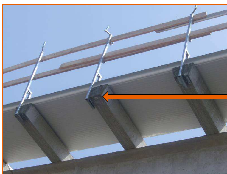
Particolare del fissaggio inadeguato di un montante