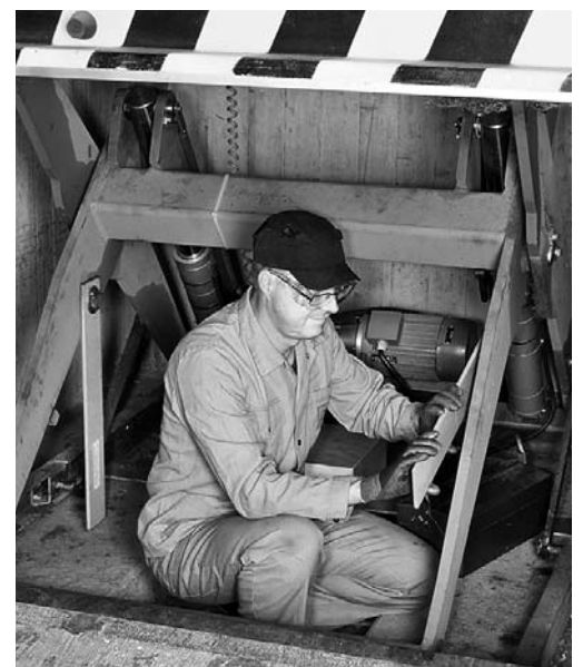
Fig. 4: in posizione sollevata la piattaforma viene messa in sicurezza con gli stabilizzatori.