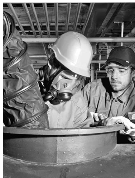
Fig. 8: ventilatore aspiratore installato per lavorare in una cisterna

È possibile che nella vostra azienda esistano altre fonti di pericolo riguardanti il tema della presente lista di controllo.