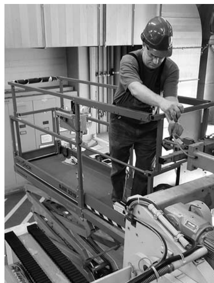
Fig. 5: per i lavori di lubrificazione in altezza si usa una piattaforma di lavoro elevabile.

Ad es. elettricisti professionisti o persone esperte nel ramo dell'elettrotecnica per un'attività ben determinata e circoscritta. Le autorizzazioni e le attività di formazione devono essere documentate (fig. 6).