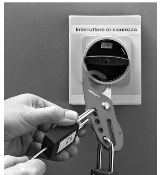
Fig. 3: interruttore per la revisione bloccato con il lucchetto personale e il dispositivo di chiusura multipla