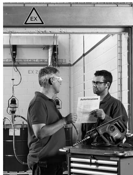
Fig. 7: per lavorare nelle zone ex serve un permesso scritto. Una misura di protezione possibile è rimuovere le sostanze a rischio incendio ed esplosione dall'ambiente in cui si interviene e dai locali adiacenti.