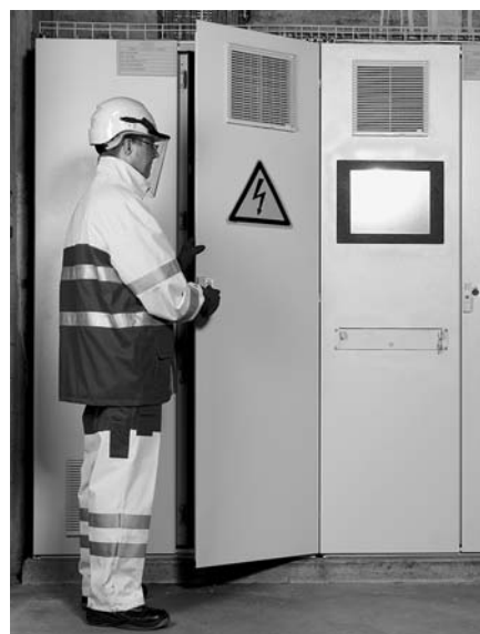
Fig. 6: l'accesso al quadro elettrico è regolamentato.