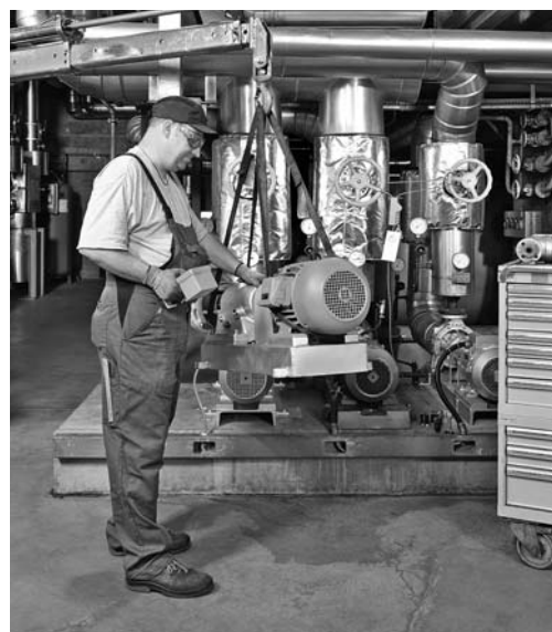
Fig. 2: il manutentore usa le attrezzature prescritte (in questo caso la gru).