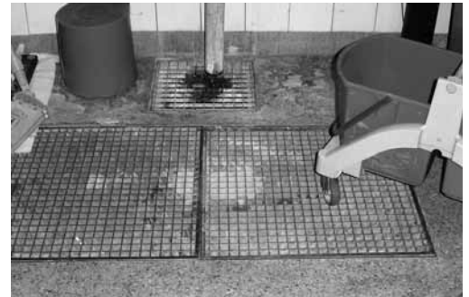
Fig. 1: pavimenti con grigliati a filo dotati di superficie antiscivolo per evitare infortuni.

Nota: i pavimenti in ceramica o pietra si possono rendere antiscivolo anche in un secondo tempo.