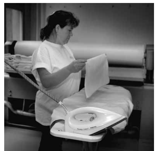
Fig. 11: quando non si stira, il ferro va sistemato in un posto sicuro. Se i ritmi di lavoro sono frenetici, non basta appoggiare il ferro sulla base dell'asse da stiro.

È possibile che nella vostra azienda esistano altre fonti di pericolo riguardanti il tema della presente lista di controllo. In tal caso, occorre adottare i necessari provvedimenti (vedi pag. 4).