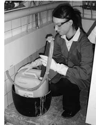
Fig. 8: usare occhiali e guanti di protezione quando si lavora con detersivi concentrati.