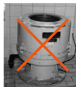
Fig. 4: le centrifughe senza blocco del coperchio vanno messe fuori servizio.