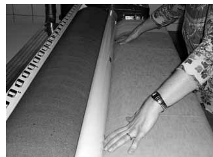
Fig. 3: mangano con protezione per dita e mani. La macchina si arresta non appena si entra in contatto con il dispositivo di protezione.