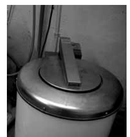
Fig. 5: coperchio bloccato.