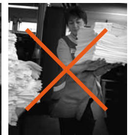
Fig. 9 e 10: con la visuale libera si evita di inciampare, scivolare e andare a sbattere.