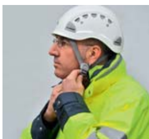
1 Indossare il casco con sottogola.