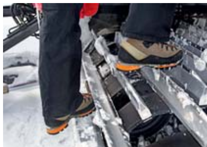
2 Calzature con suola antiscivolo.