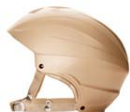
2 Indossare il casco.