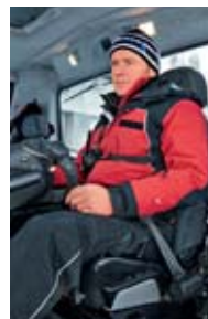
3 Allacciare le cinture di sicurezza.