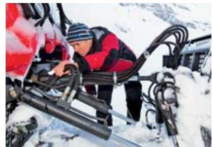
4 Controllo prima dell'utilizzo.