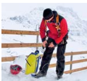
2 Regolare i DPI anticaduta.