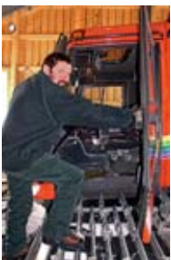
1 Afferrare la maniglia.