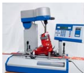
1 Far regolare gli attacchi.