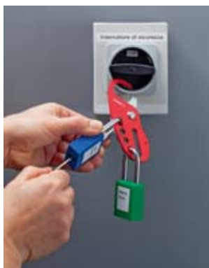
1 Dispositivo di chiusura multipla con lucchetto personale.