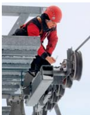
2 Sui piloni è possibile togliere la barretta di rottura.

Se per motivi particolari l'impianto deve rimanere in funzione (ad es. per lubrificare le selle delle funi, verificare l'assenza di vibrazioni nelle rulliere, spostare sospensioni di skilift, ecc.), considerare i seguenti aspetti.