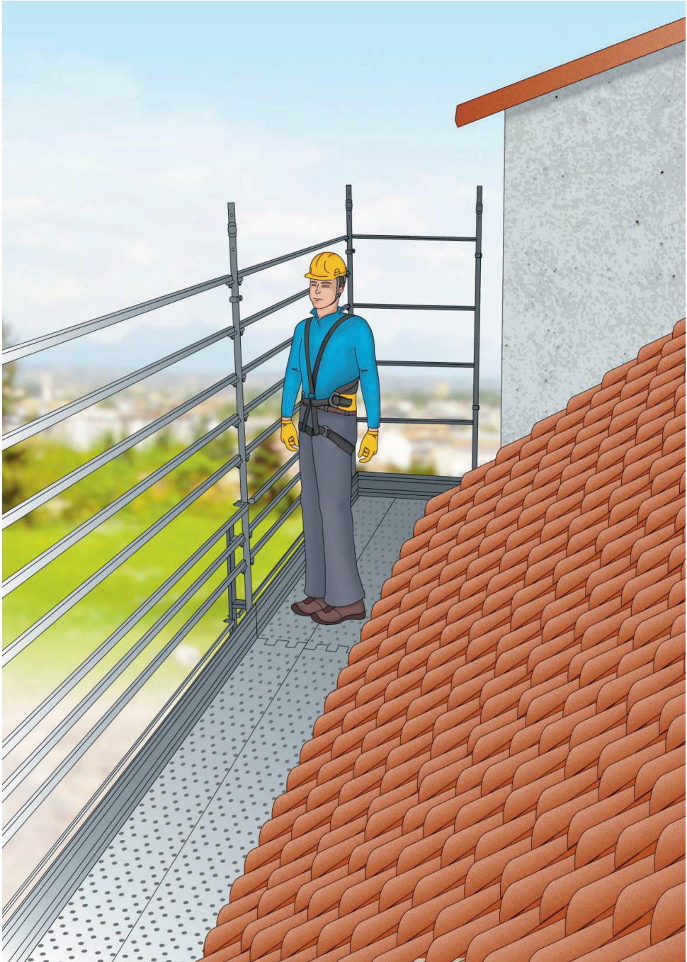
Figura 4 - Esempio di ponteggio utilizzato per la protezione dei bordi