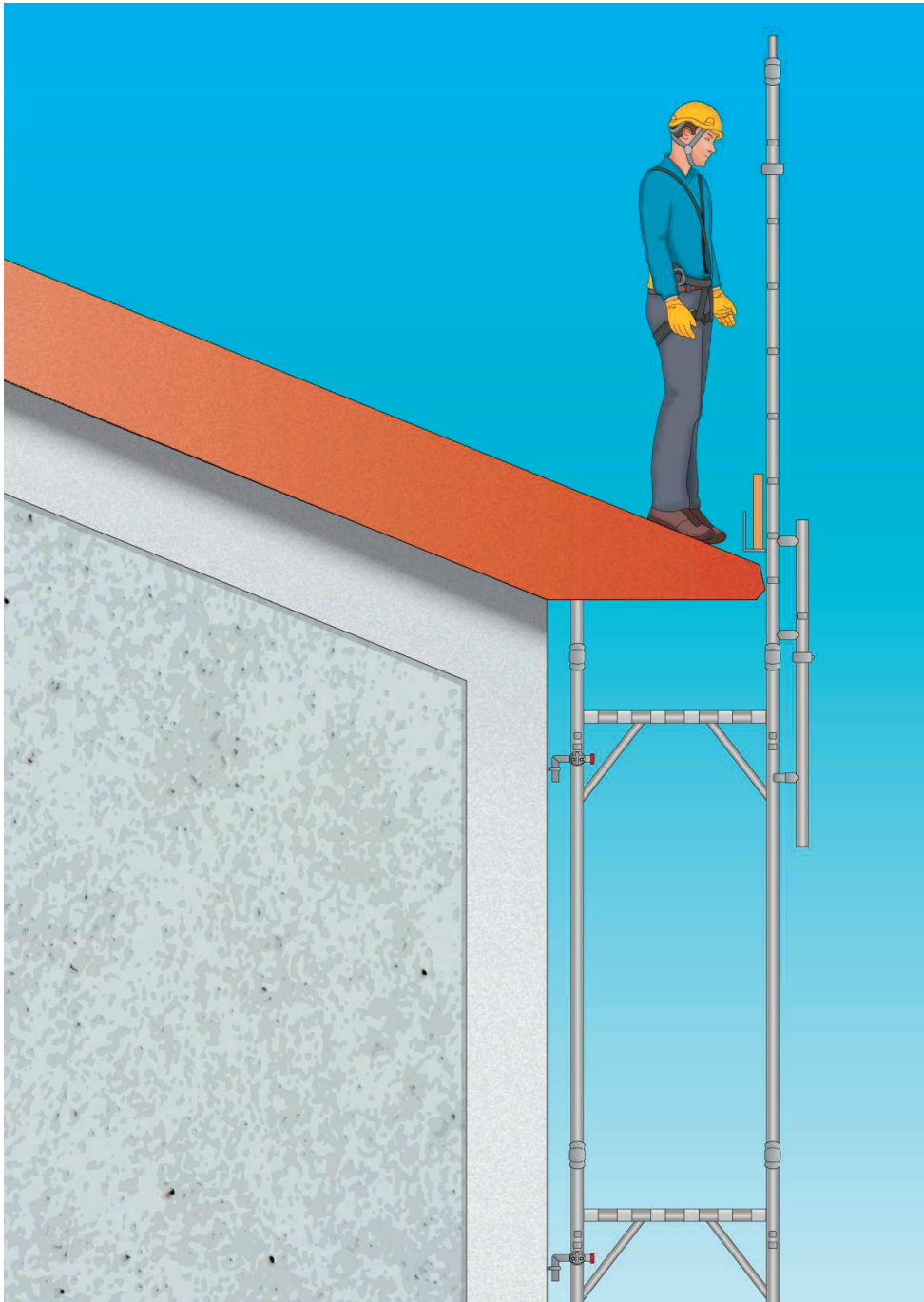
Figura 5 - Esempio di ponteggio utilizzato per la protezione dei bordi