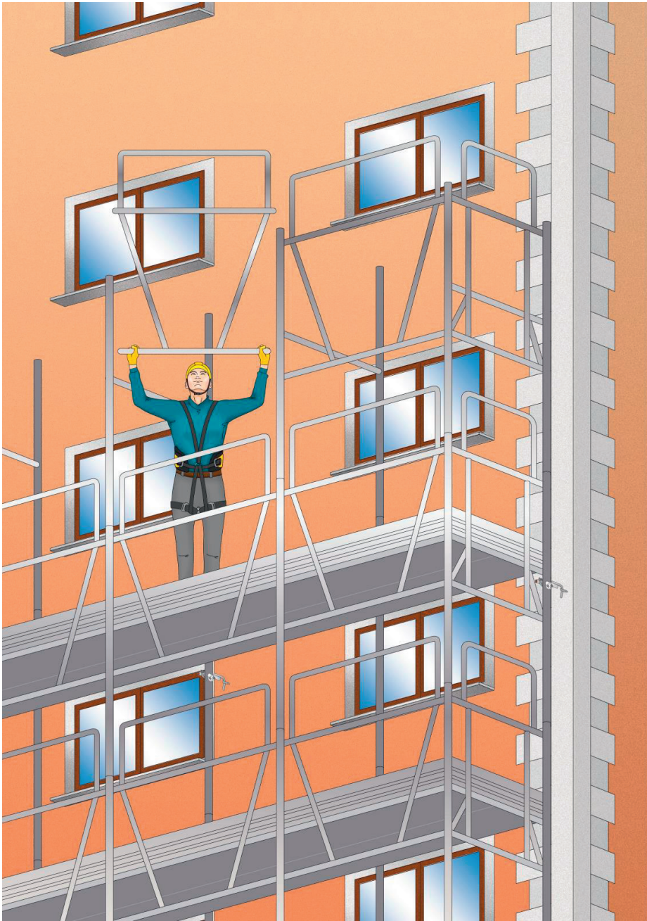
Figura 6 - Montaggio di un ponteggio con telaio parapetto (montaggio dal basso)