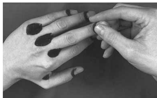
Figura 4: quando si protegge la pelle non bisogna dimenticare la zona attorno alle unghie.