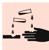
Figura 2: se l'etichetta indica che il prodotto è «causticante», aumentano i rischi di affezioni per la pelle. Proteggere la pelle, in particolare modo mediante l'uso di guanti idonei, diventa quindi un obbligo.