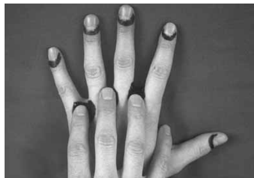
Figura 3: la crema per la cura e la protezione della pelle va applicata anche tra le dita.