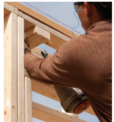
La penetración del clavo a través de la madera es una preocupación especial cuando la pieza se posiciona con la mano