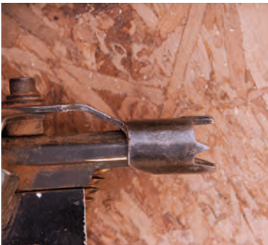
Dispositivo de contacto de seguridad