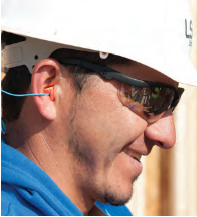
Trabajador que usa el EPI recomendado cuando trabaja con pistolas de clavo: casco, gafas de seguridad y protección auditiva

amarrar, pegar o asegurar de otra manera el gatillo para que no necesite ser apretado. La adulteración aumenta las posibilidades de que la pistola de clavos se le dispare involuntariamente al usuario actual o a cualquier otra persona que pueda utilizarla. Los fabricantes de pistolas de clavos advierten categóricamente contra las adulteraciones y OSHA exige que las herramientas se mantengan en condición segura. NO hay una razón legítima para modificar o desactivar un dispositivo de seguridad de una pistola de clavos.