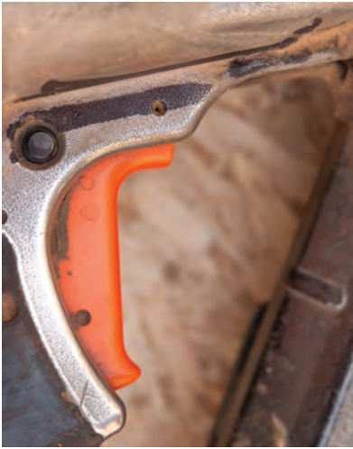
Disparador o gatillo