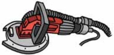
Molatrice per pietra