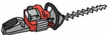
Decespugliatore (a benzina)