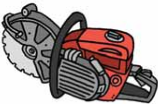
Fresa per pietra