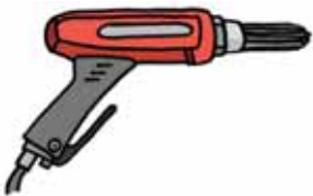
Martello ad aghi pneumatici