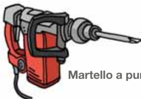
Martello a punta