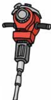
Rincalzatore portatile (a benzina)