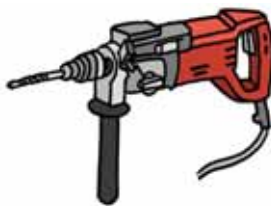
Trapano a percussione