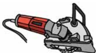
Fresatrice per muri