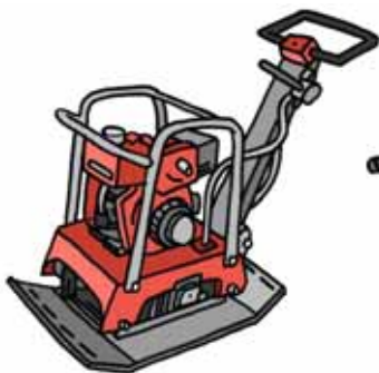
Costipatore a piastra vibrante