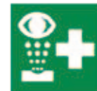
Lavage des yeux