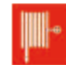
Canon à eau