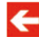
Direction à suivre