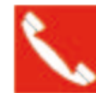
Téléphone pour la lutte contre l'incendie