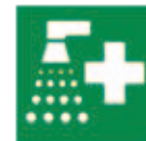
Douche de sécurité