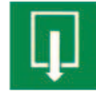
Direction à suivre - Parcours - Sorties de secours