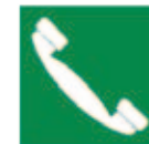
Téléphone pour sauvetage et premiers secours