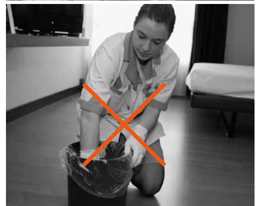
Figure 3 e 4: per evitare di ferirsi con siringhe o tagliarsi con vetri chiudere e trasportare i sacchi della spazzatura senza schiacciarli.