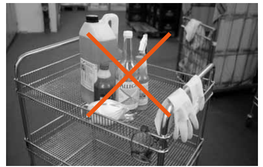
Fig. 5: per evitare intossicazioni conservare i detersivi nei contenitori originali.