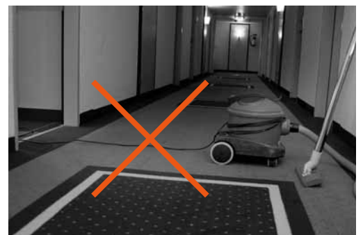
Fig. 8: i cavi a terra nei corridoi possono far inciampare.