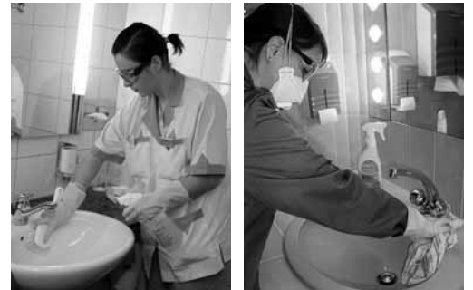
Figure 6, 7: proteggersi quando si usano decalcificanti acidi. Se l'aerazione è insufficiente, usare la mascherina.