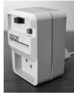
Fig. 1: le prese salvavita (interruttori FI) si trovano nei negozi specializzati.

Nota: i pavimenti in ceramica o pietra si possono rendere antiscivolo anche in un secondo tempo.