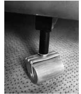
Fig. 2: applicare rotelle al letto permette di rifare il letto senza danneggiare la schiena.